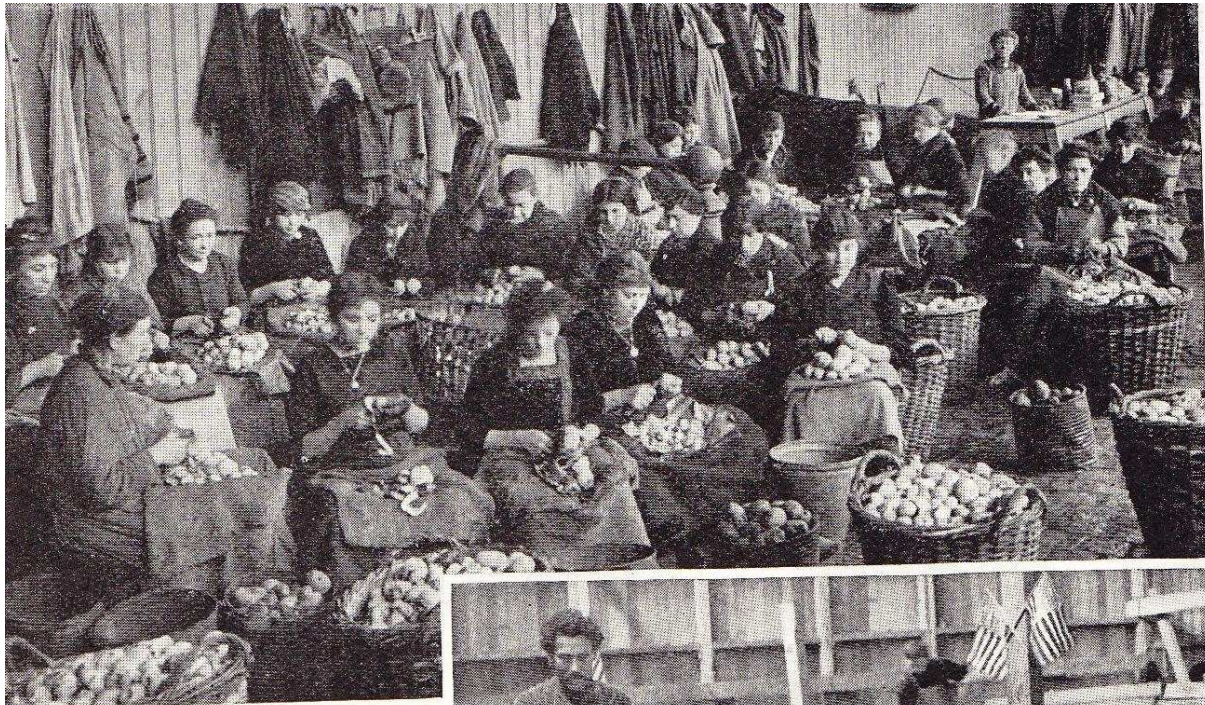
Épluchage des légumes.